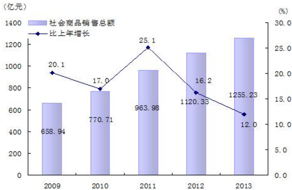
图3 社会商品销售总额与增长

至年末，全区入驻连锁品牌共计 64 家，全年连锁业态实现社会消费品零售额 49.62 亿元，比上年增长 19%，占全区零售额的比重为 11.6%。全区拥有商品交易市场 79 个，其中，专业市场 24 个，集贸市场 55 个。全年共实现成交额 345.53 亿元，比上年下降 14.2%，其中，专业市场成交额 326.9 亿元，下降 15.3%，集市贸易成交额 18.63 亿元，增长 11.8%。