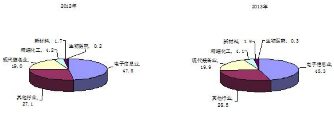
图 2 五大主导产业占工业总产值比重

工业转型升级积极推进。坚持“区区合作、品牌联动”发展模式，加强与漕河泾开发区合作，余北工业区等老工业区区块转型改造顺利实施。上海漕河泾开发区松江园科技绿洲项目顺利推进，库卡机器人项目建成运营，斐讯通信总部竣工。IBM 大中华区首个移动互联定制中心、上海联合产权交易所落户。全年五大主导产业实现工业总产值 2713.19 亿元，比上年增长 0.9%。其中，电子信息业实现产值 1719.11 亿元，比上年下降 1%；现代装备业实现产值 754.89 亿元，增长 2.4%；精细化工实现产值 153.86 亿元，增长 11%；新材料实现产值 73.56 亿元，增长 9.2%；生物医药实现产值 11.77 亿元，比上年增长 23.5%。从各产业占工业总产值比重看：电子信息业占全区工业产值的比重由上年的 47.8% 下降至 45.3%，精细化工占全区工业产值的比重由上年的 4.2% 下降至 4.1%，现代装备业、新材料、生物医药所占比重分别比上年提高 0.9 个、0.2 个和 0.1 个百分点（见图 2）。